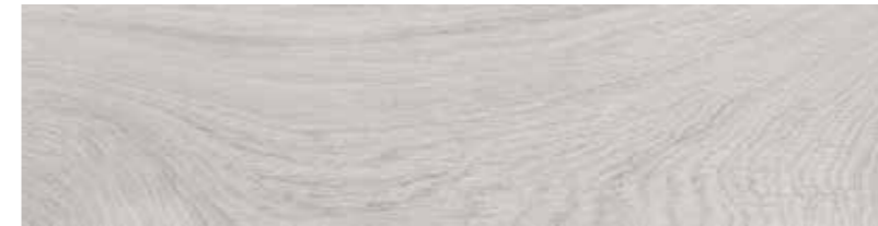
22,8x91,5 Arbor Grigio