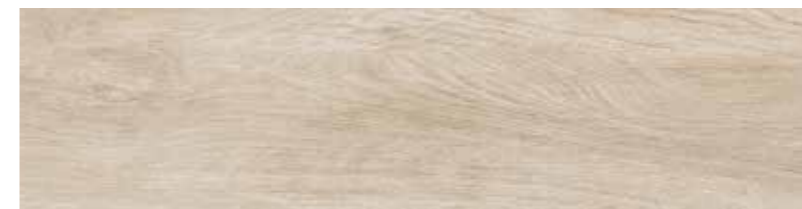
22,8x91,5 Arbor Beige