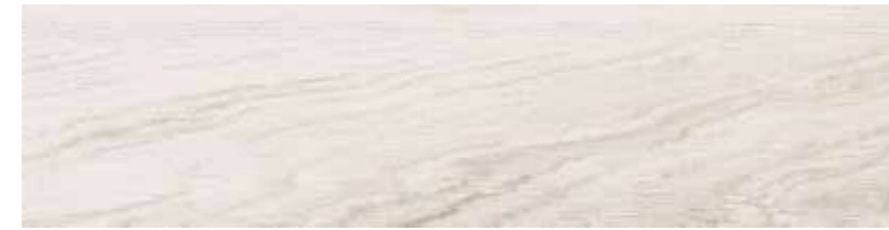
22,8x91,5 Arbor Bianco