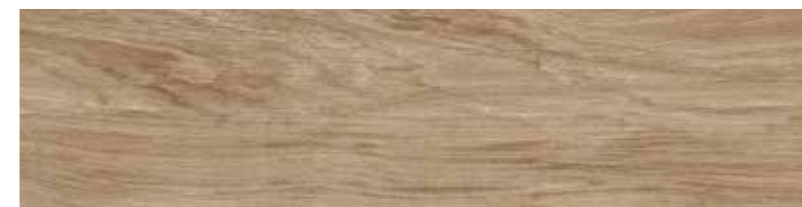
22,8x91,5 Arbor Noce